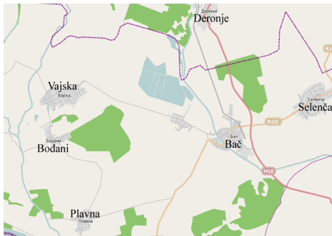
Слика 1: мапа Бача

Према степену развијености општина Бач спада у трећу групу недовољно развијених општина чији је степен развијености у распону од 60% до 80% републичког просека.