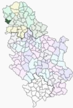
Општина Бач у Србији