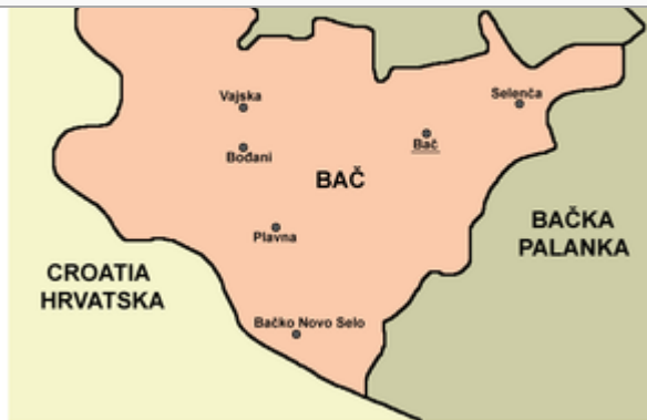
Bač Municipality / Opština Bač